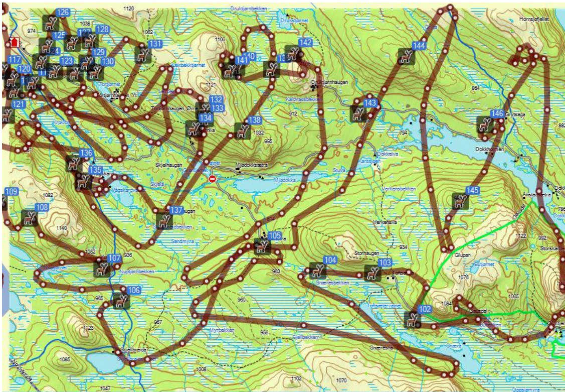
Bilde 1: Kartbildet viser flyrute og plasser hvor det ble observert elg i den sørøstlige delen av telleområdet.