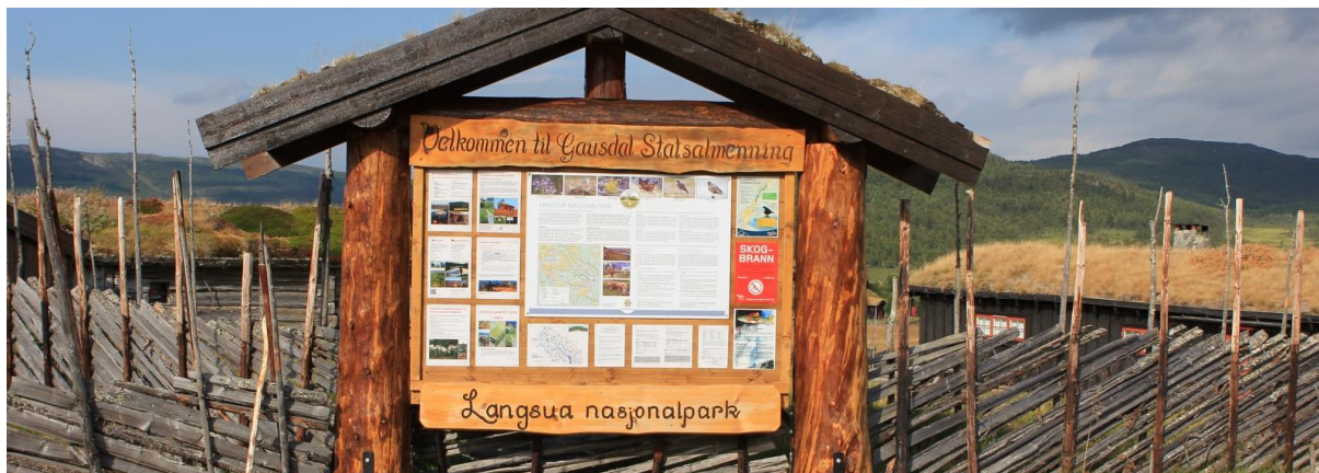
Renovert info tavle på Liomsetra, 31. juli 2018