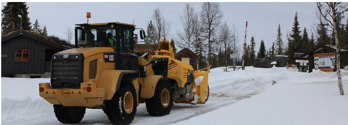
Sønsthage Maskin AS brøyter ved Holsbru 25. april 2018