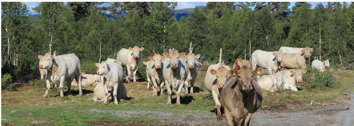
Storfe i Dokkhamninga 4. august 2018