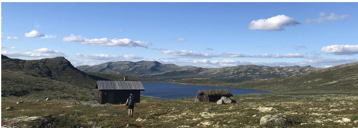
Megrundsua 1. august 2018

De åpne buene er mye brukt og et stort pluss for Vestfjellet og Langsua Nasjonalpark, men de er også en stor utgiftspost for fjellstyret. Utleieinntektene fra småviltjakta bidrar litt til å opprettholde tilbudet om åpne buer for allmenheten resten av året. Årets taksering viste en fin oppgang i rypebestanden sammenlignet med 2017. Dette førte naturlig nok til mere etterspørsel etter husrom i småviltjakta.