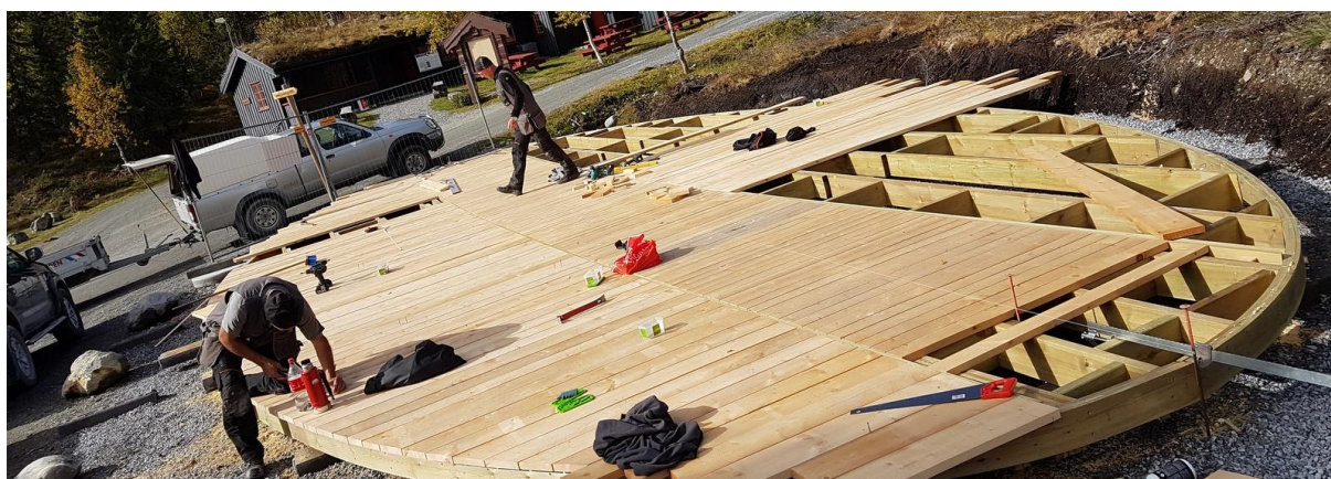
Bygging av nytt infopunkt på Holsbru 18. september 2018

På Ånstadsetra ble det gjennomført skjøtselshogst på utsida av lykkja.