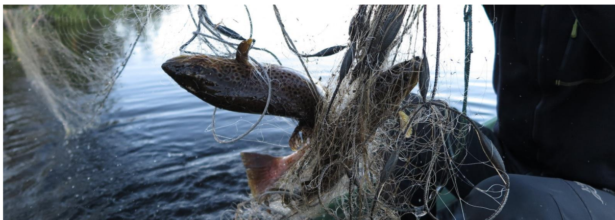
Prøvefiske på Glåmen 2. september 2018.

Årlig blir det gjennomført fiskeundersøkelser og prøvefiske. I 2018 ble det prøvefisket i Glåmen, Tverrlitjønnet og Snæra. På Snæra fikk fjellstyret god prøvefiskehjelp av flinke elever fra Dokka videregående. Resultater fra prøvefiske som egen rapport på www.gausdal-fjellstyre.no .