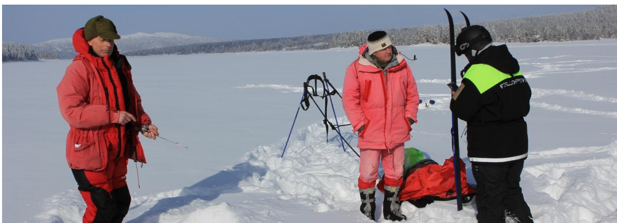
Isfiskere og fjelloppsyn på Hornsjøen, 9. mars 2018

Det ble brukt 919 arbeidstimer på oppsyn i 2018. Totalt brukte fjellstyrets ansatte 4982 arbeidstimer fordelt på oppsyn, skjøtsel/vedlikehold, saksbehandling/administrasjon og tjenestesalg (Langsua nasjonalparkstyre, SNO, DNT, Liumsetervegen SA og Torpa fjellstyre).