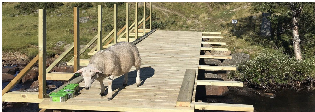
Bygging av ny bru over Liumseterbekken, i samarbeid med DNT Oslo og Omegn, 9. august 2018

Det er også gjort en del vedlikehold og utskifting av skilt.