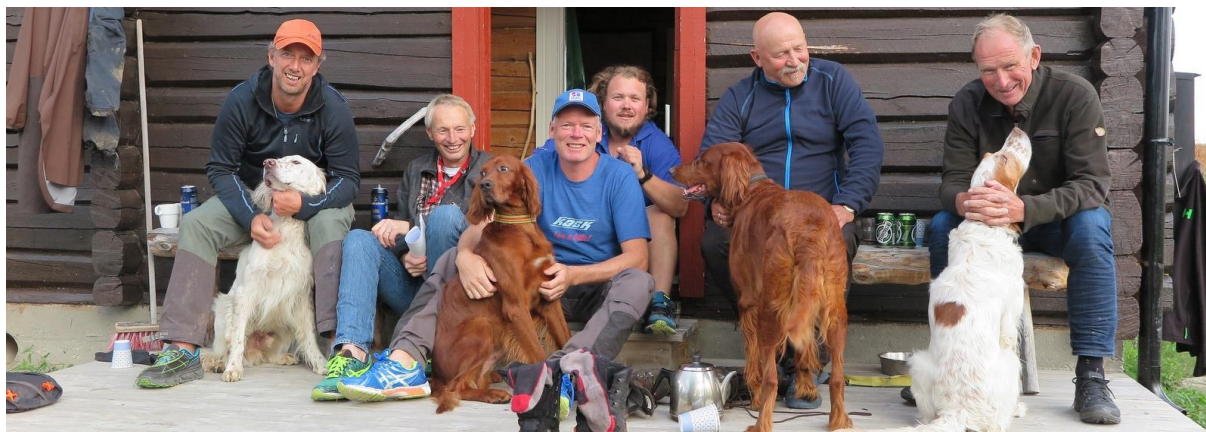
Fornøyde rypetakserere på Fehytta Liomseter, 4. august 2018