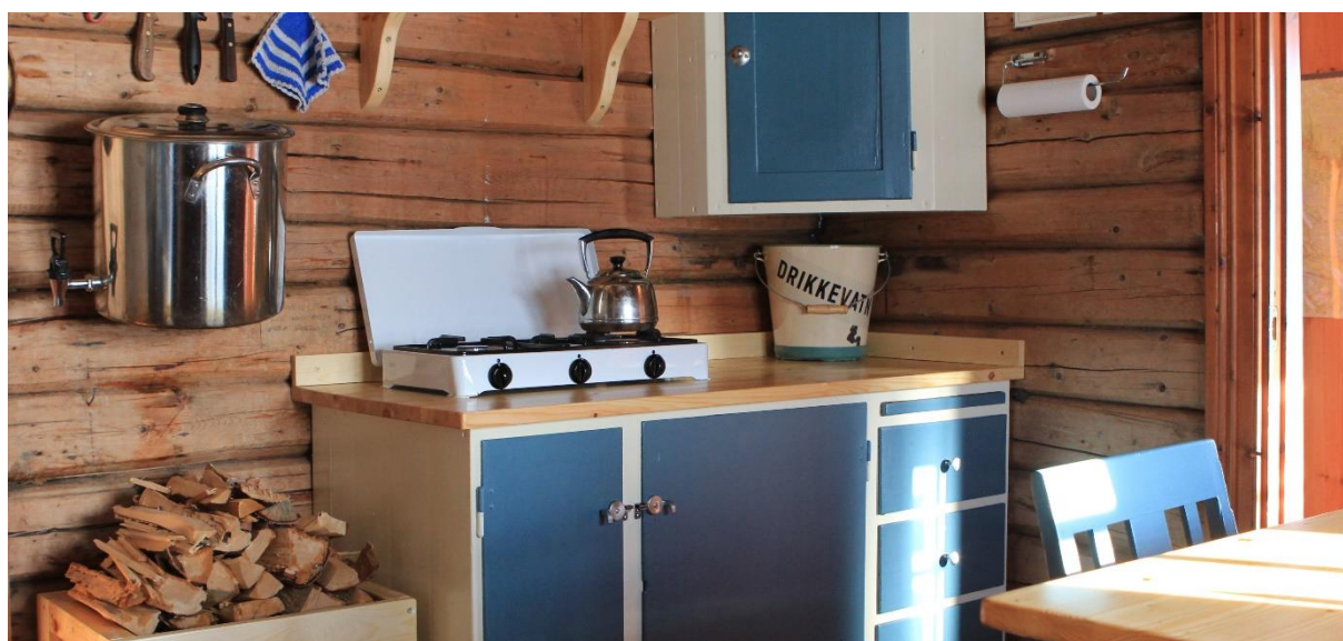
Leppehytta 21. februar 2020