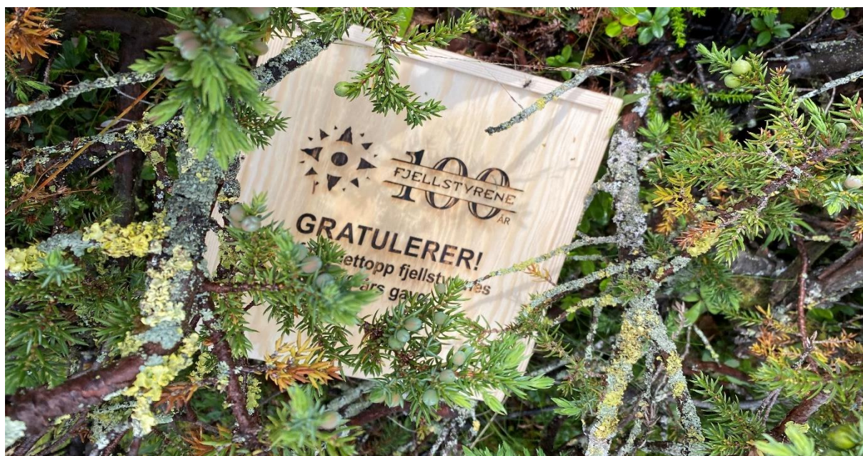
Gaveboks ved Snæra, august 2020

I 2020 feiret fjellstyrene 100 år. I den forbindelse ble det lagt ut 100 gavebokser i landets statsallmenninger. De som fant en slik boks, vant gratis fiske i 100 år. I Gausdal statsallmenning ble boksen lagt ved en fin fiskeplass på vestsida av Snæra. Den lå der en god stund uten å bli funnet, men i midten av august var det en heldig fisker som kunne innkassere 100 års gratis fiske i vestfjellet.