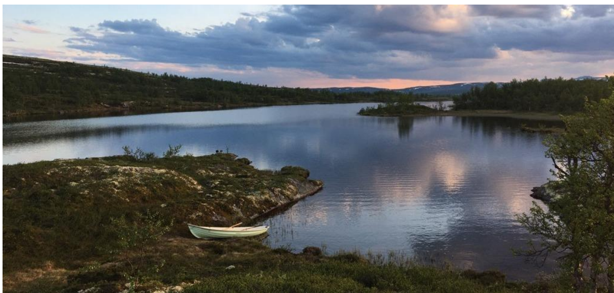
Tverrlitjønnen 19. juni 2020

Det ble brukt 969,5 arbeidstimer på oppsyn i 2020. Totalt brukte fjellstyrets ansatte 4638,5 arbeidstimer fordelt på oppsyn, skjøtsel/vedlikehold, saksbehandling/administrasjon og tjenestesalg (Langsua nasjonalparkstyre, SNO, DNT, Liumsetervegen SA og Torpa fjellstyre).