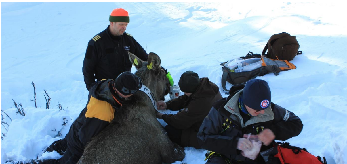
Merking av elg i Dokkfaret 12. mars 2020: Foto: Gausdal fjellstyre