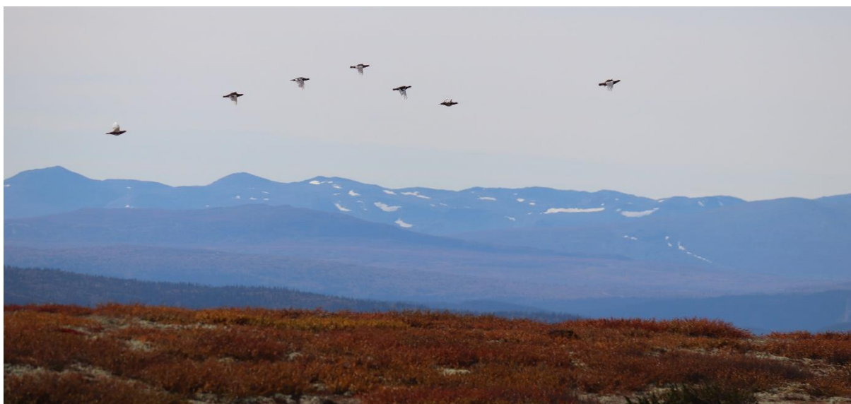
Ryper i Vesterheimen, september 2020