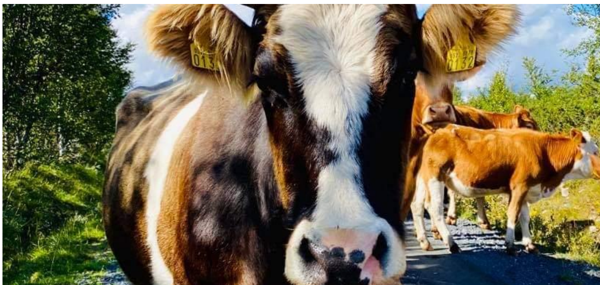
Storfe på Reinsåsen, 30. august 2020