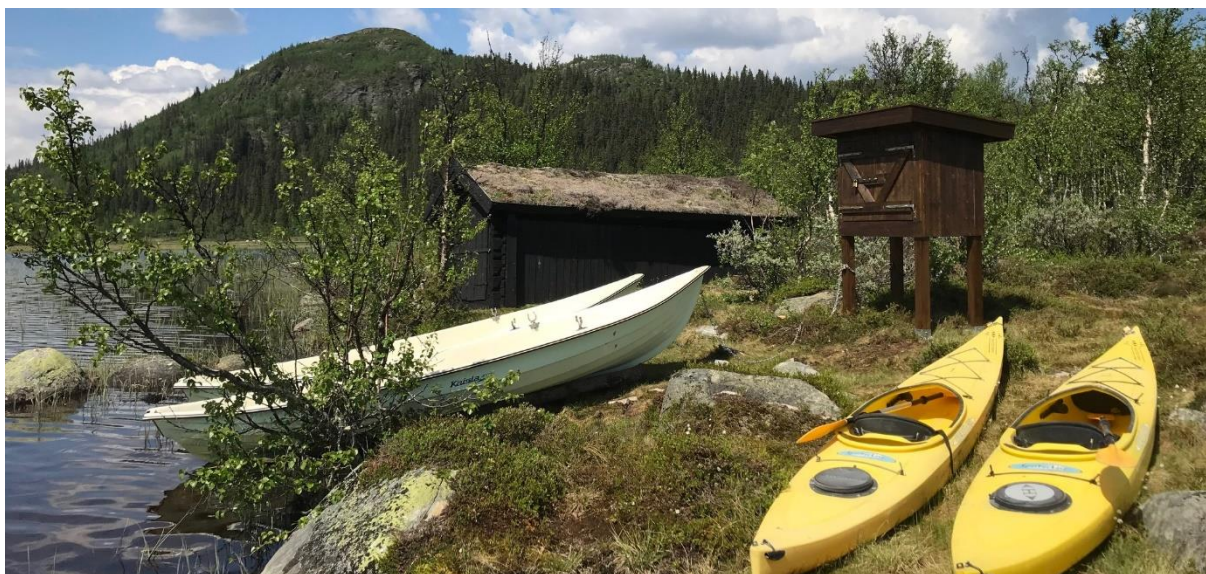
Båter og kajaker klare for utleie på Snæra, 16. juni 2020