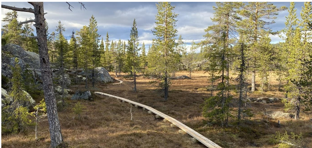
Klopplegging over blaut myr fra Holsbru kafe til Dokkelva, 17. oktober 2020

Det er også gjort en del vedlikehold og utskifting av skilt.