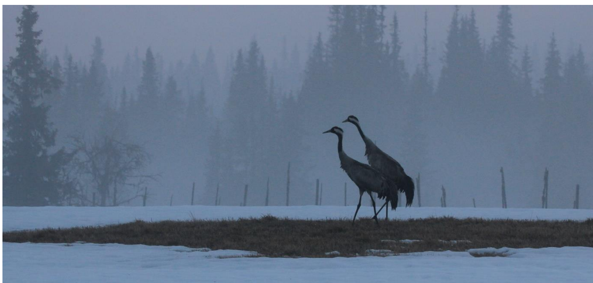
Tranepar på barfleck, 14. mai 2021

Ellers har det blitt gjennomført normalt veivedlikehold med grusing, slådding og salting.