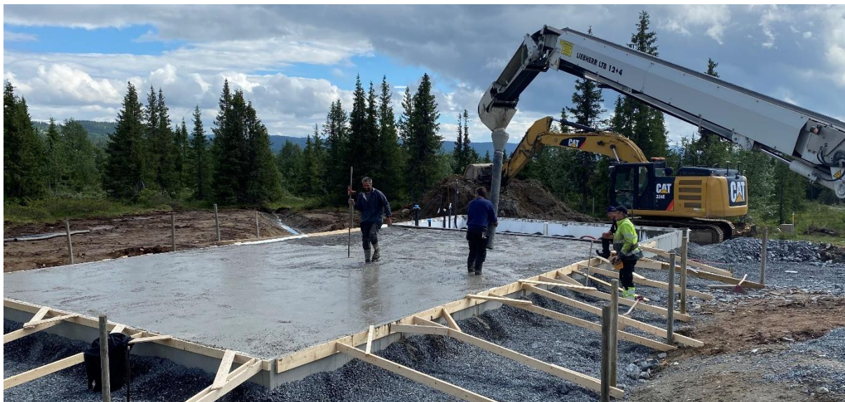
Støping av dekke til nytt uthus, 8 juli 2021