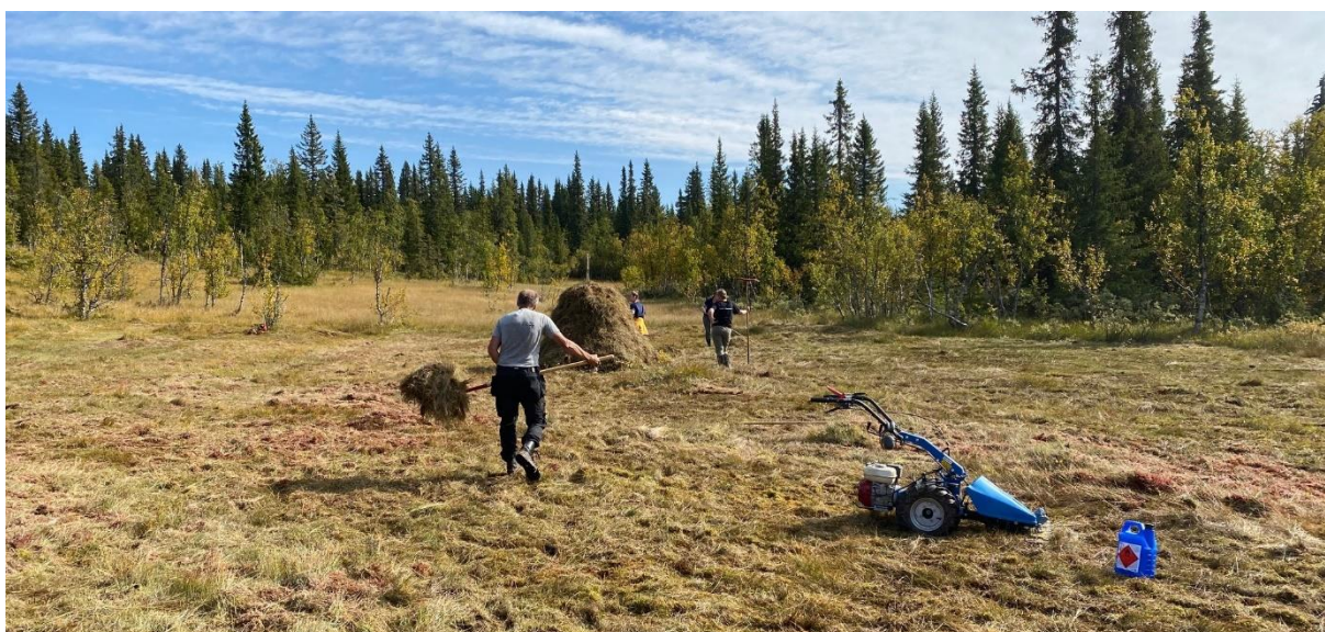
Myrslått på Reinsåsen,, 2. september 2021.

Liumsetervegen SA kjøper tjenester av fjellstyret på drift av bommen ved Holsbru og div. vedlikeholdsoppgaver på Liumsetervegen (70 arbeidstimer)