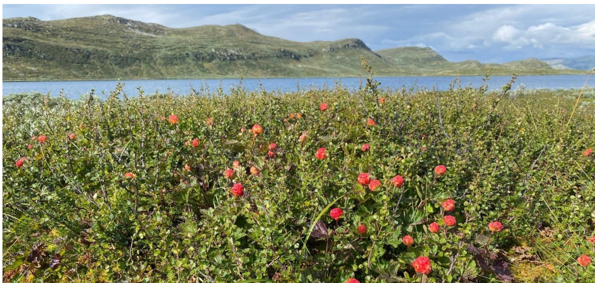
Snart modne multer, Øvre Megrundstjønn 6. august 2021

Informasjon og salg via www.inatur.no er også en viktig informasjonskanal. I tillegg driver Norges fjellstyresamband aktiv markedsføring av fjellstyrenes tilbud via egne nettsider, www.fjellstyrene.no , og facebook, www.facebook.com/fjellstyrene . Denne samlede markedsføringen er svært viktig for fjellstyrene.