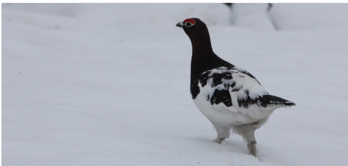
Rypestegg, 24. mai 2021

Øvrig småviltjakt går som normalt iht. driftsplan og gjeldende jaktregler.