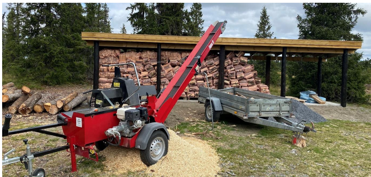
Vedproduksjon til utleiehyttene, 21. august 2021