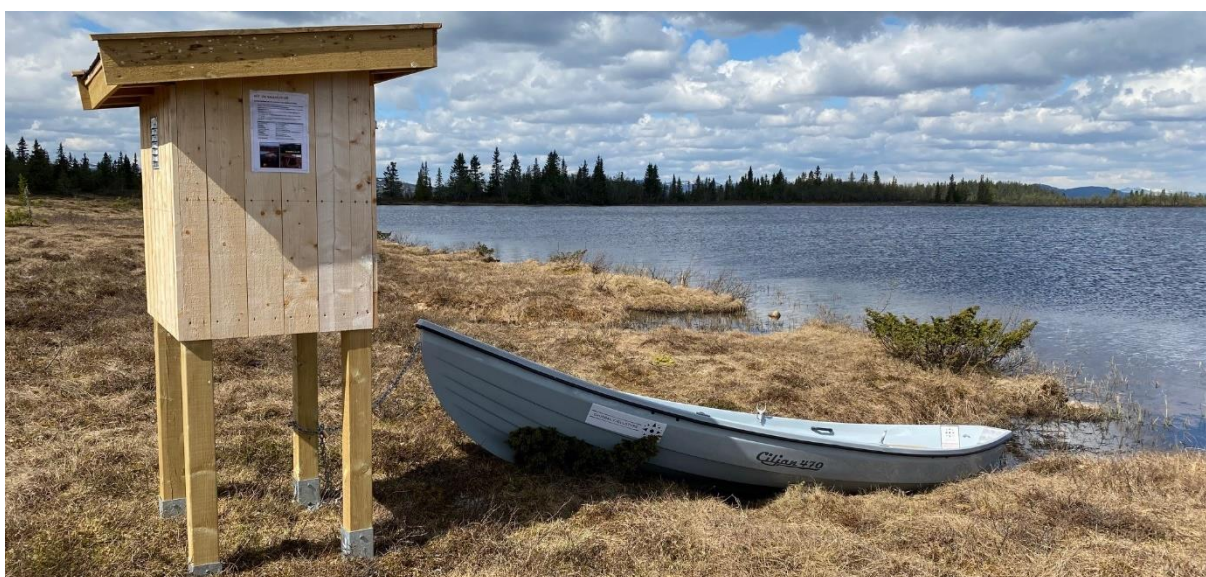
Ny utleiebåt på Morgobeittjønnnet, 3. juni 2021

Etter at det ble mulighet for å leie/booke båt via www.inatur.no har antall utleiedøgn doblet seg.