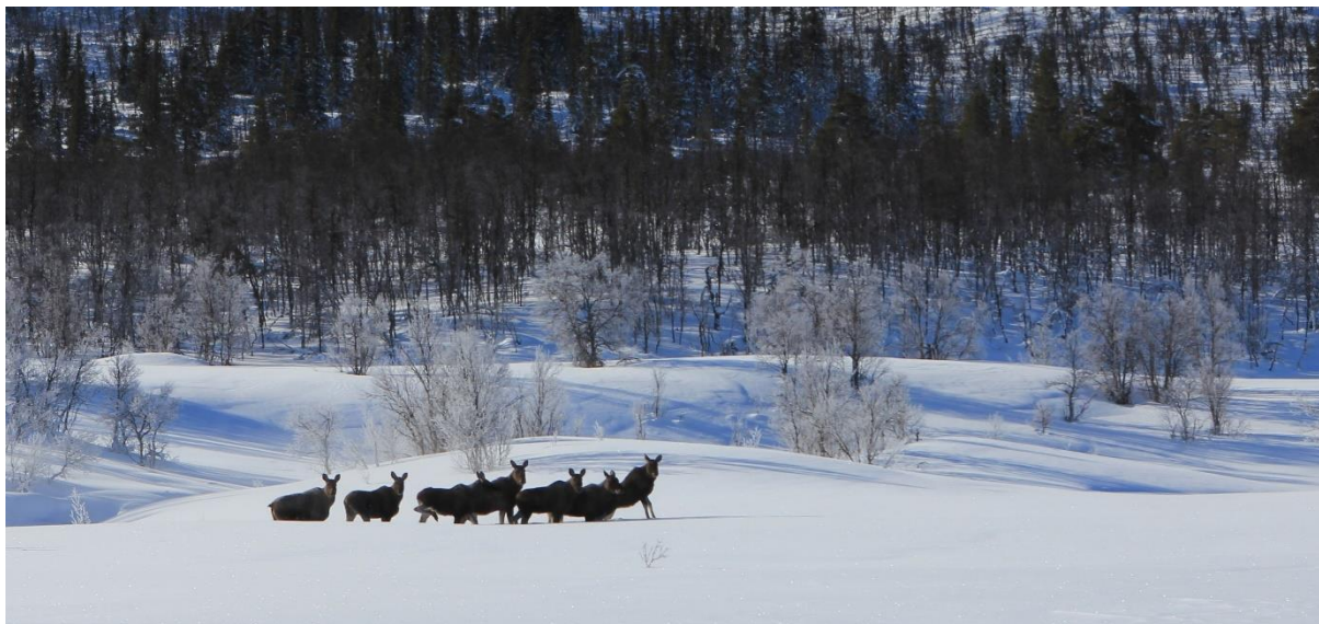
Elggjengen ved Snæresbekken, 13. mars 2021