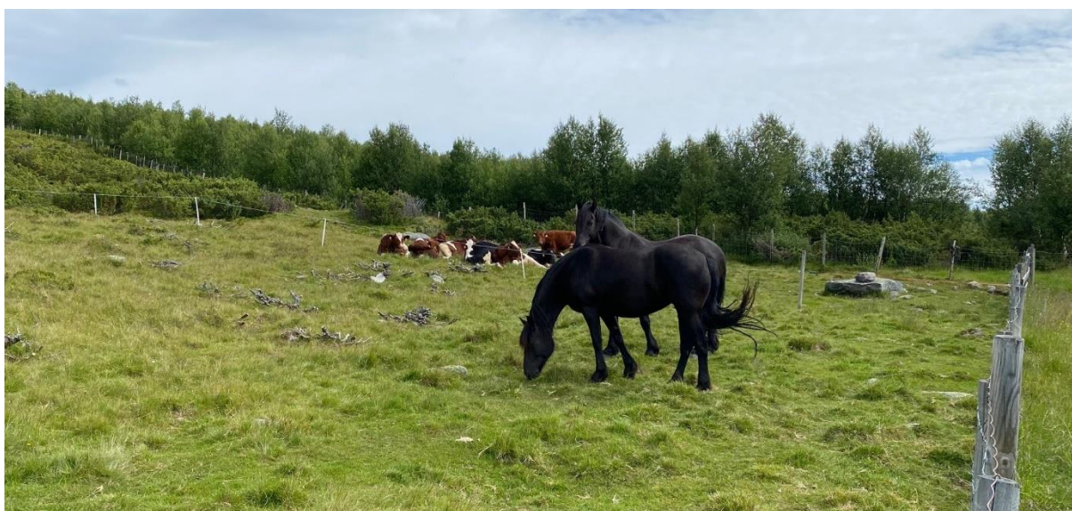
Hest og storfe på Liomsetra, 13. juli 2021

I tillegg beitet det 12 geiter og 8 kje i området rundt Liomseter