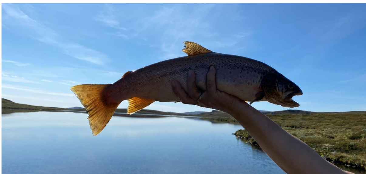
Megrundsørret, 30. august 2021

Resultater fra prøvefiske som egen rapport på www.gausdal-fjellstyre.no