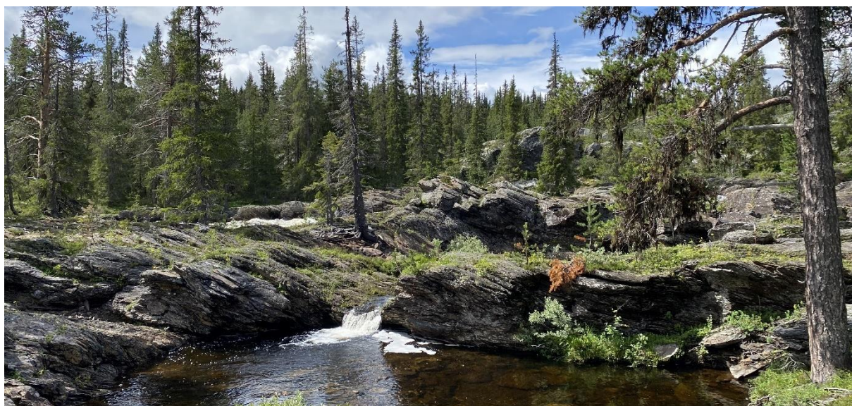
Ved Dokkelva, 20. juli 2023

Informasjon og salg via www.inatur.no er også en viktig informasjonskanal. I tillegg driver Norges fjellstyresamband aktiv markedsføring av fjellstyrenes tilbud via egne nettsider, www.fjellstyrene.no , og facebook, www.facebook.com/fjellstyrene . Denne samlede markedsføringen er svært viktig for fjellstyrene.