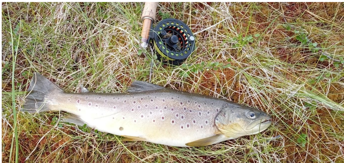
Ørret på 1,2 kg. 23. juli 2023

Resultater fra prøvefiske som egen rapport på www.gausdal-fjellstyre.no