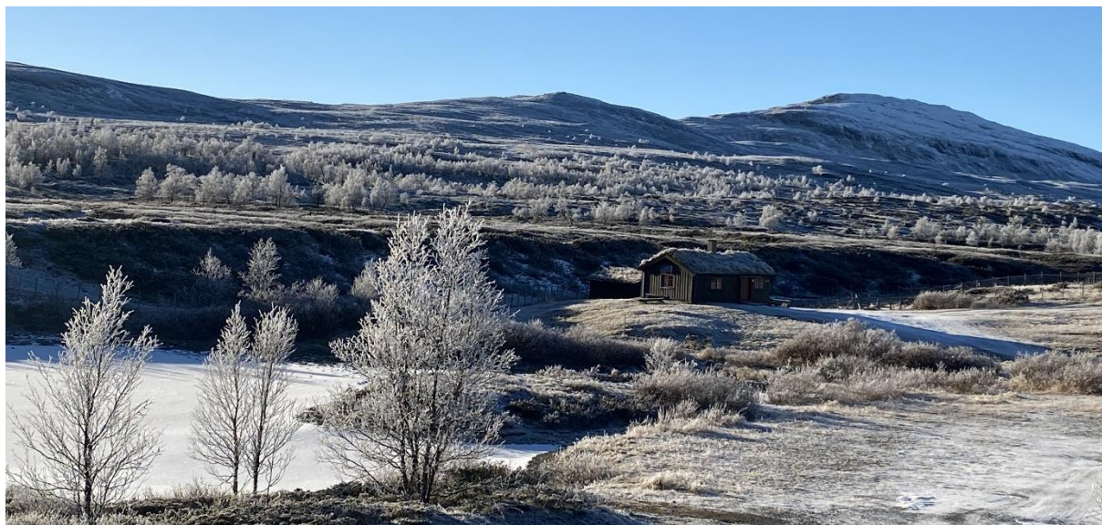
Revsjøhytta 29. oktober 2023

Det ble brukt 742,5 arbeidstimer på oppsyn i 2023. Totalt brukte fjellstyrets ansatte 4778 arbeidstimer fordelt på oppsyn, skjøtsel/vedlikehold, saksbehandling/administrasjon og tjenest salg (Langsua nasjonalparkstyre, Statsforvalteren, Liumsetervegen SA, SNO, DNT, og Torpa fjellstyre).