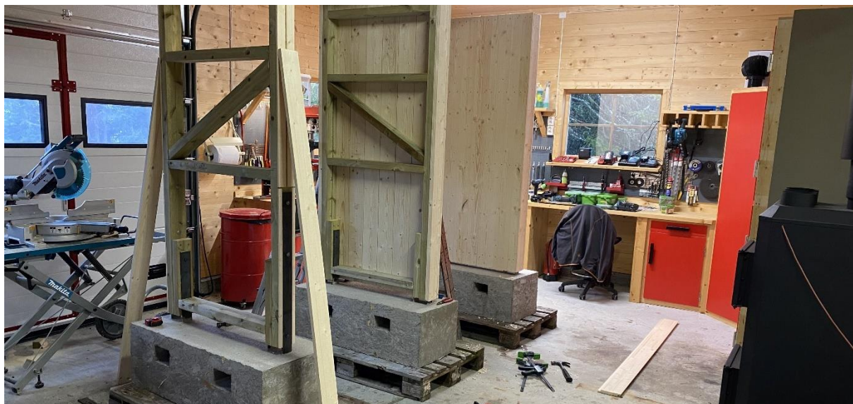
Bygging av nye infotavler, for Langsua nasjonalparkstyre, i verkstedet på Kittilbu. 18.september 2023.

I tillegg selger fjellstyret tjenester til Statens naturoppsyn (SNO), Den norske turistforening (DNT) og Torpa fjellstyre