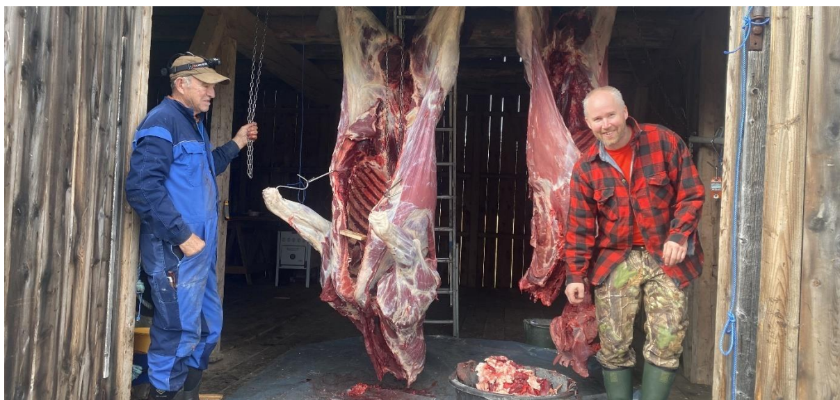
Jegere fra Ormtjønnet jaktlag med to fine elgslakt. Slaktet til venstre er årets tyngste med en vekt på 289 kg. 29. september 2023

Det har også i år blitt gjennomført sportelling av elg. Egen rapport om dette, og rapport fra elgjakta 2023, på www.gausdal-fjellstyre.no .