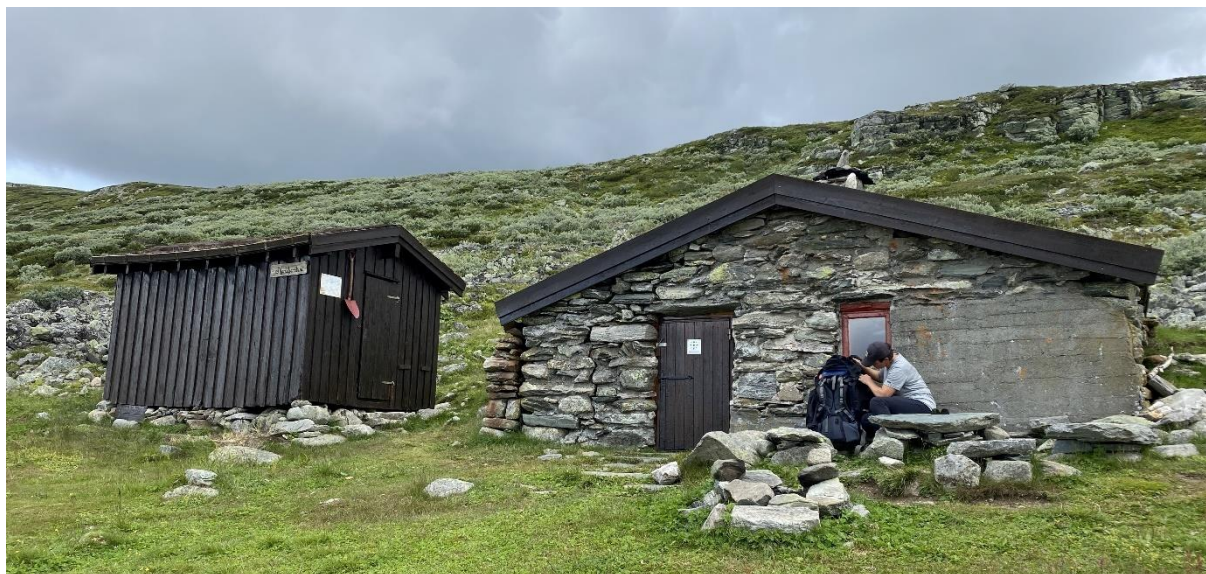
Utvendig vedlikehold på Nonstjønnbua gjennomført, 28. juli 2023