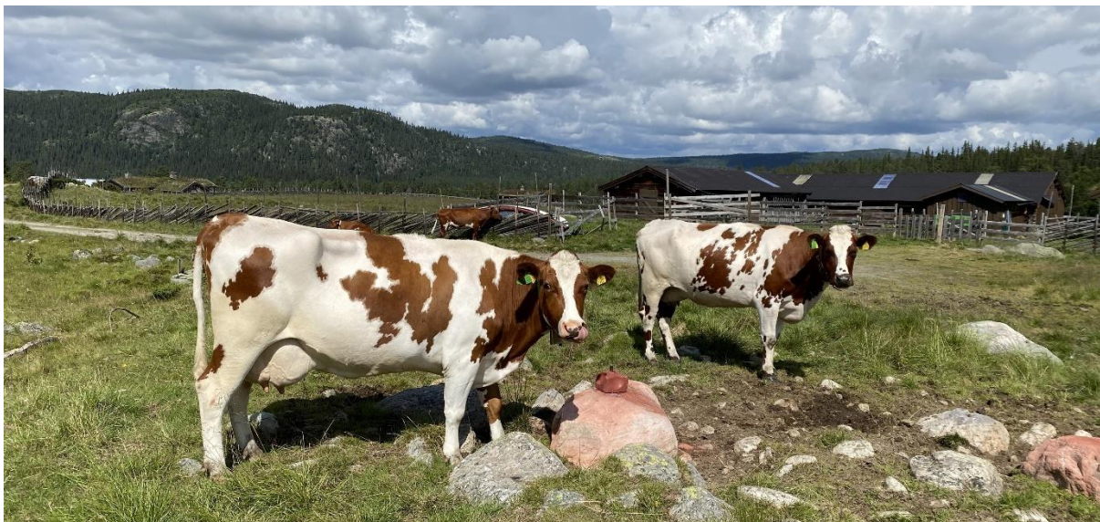
Mjølkeku ved Grytsetra, 31. juli 2023