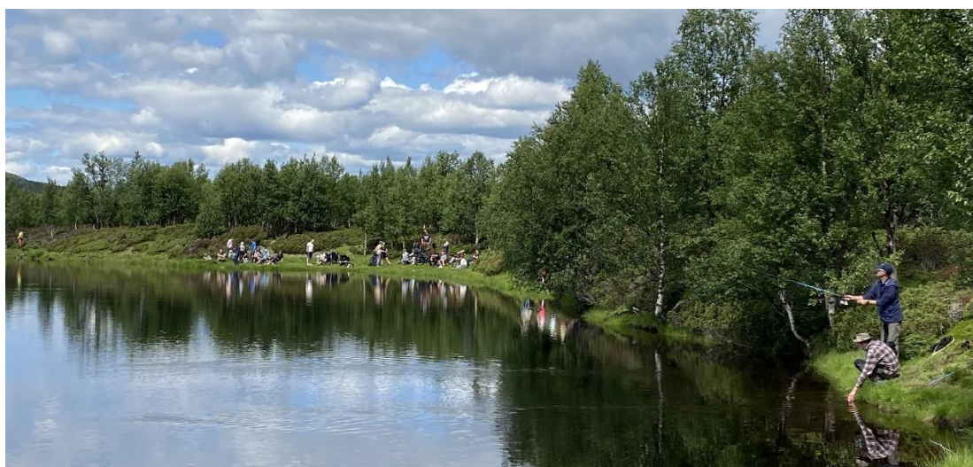
Gausdal jeger og fiskerforening arrangerer fiskekonkurransen for barn og ungdom i Revsjøtjønnet, 8. juli 2023