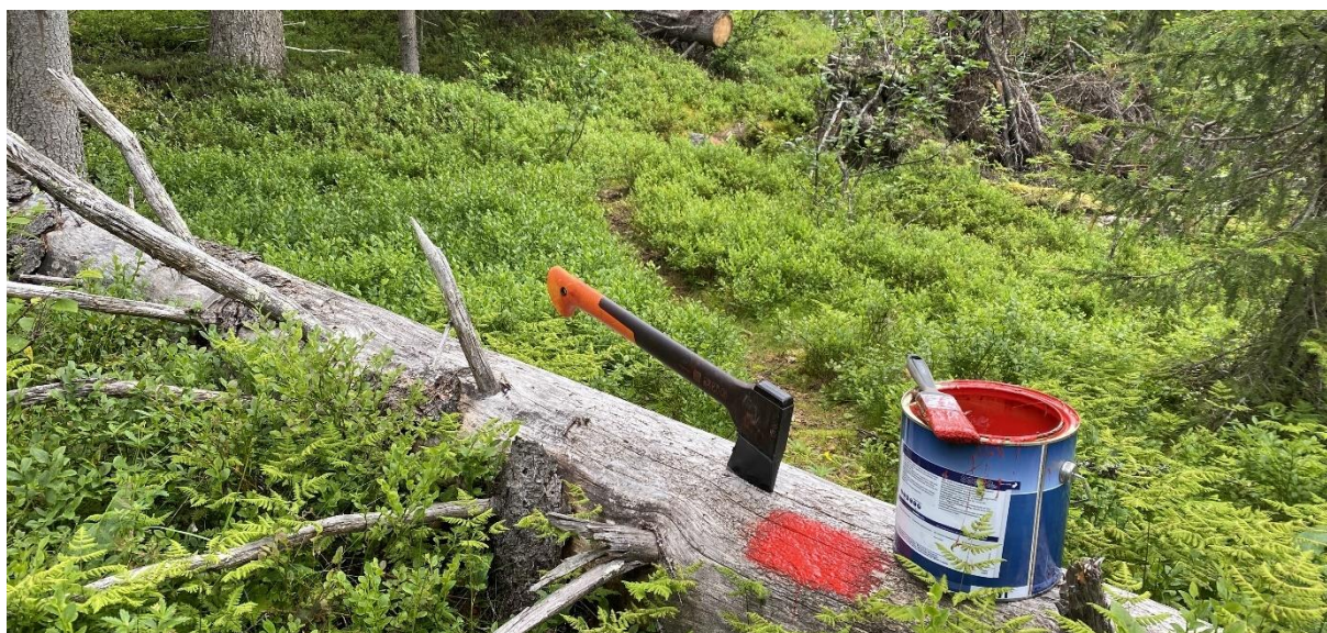
Remerking av Holsbru - Tjyruverket, 1. august 2023.

En del av rasteplassene langs Vestfjellvegen, Ormtjønnsvegen og Liumsetervegen har blitt ryddet for kratt og annen vegetasjon ved hjelp av beitepusser og motorsag. I tillegg har 1 utedo blitt skiftet ut langs Ormtjønnsvegen.